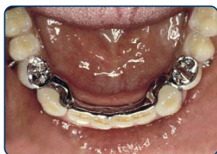
Frameprothese met verankering op kronen