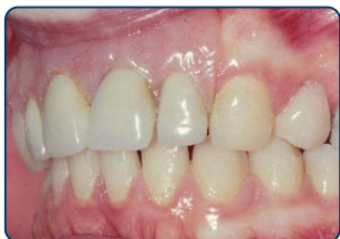
Plaatprothese van opzij