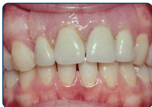
Plaatprothese van voren

De plaatprothese is gemaakt van een roze, tandvleeskleurige kunsthars. Daarin zijn de kunsttanden en -kiezen verankerd. De gehele plaatprothese rust op het slijmvlies van de mond. Deze zit eventueel met ankertjes vast aan overgebleven tanden of kiezen.